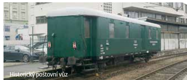
Historický poštovní vůz