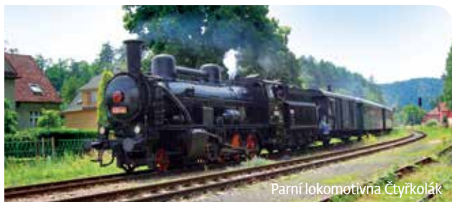
Parní lokomotivna Čtyřkolák