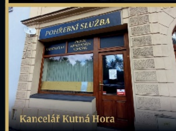
Kancelář Kutná Hora