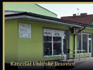
Kancelář Uhlířské Janovice