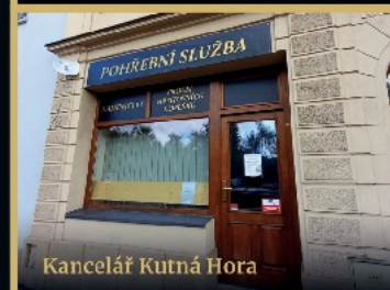
Kancelář Kutná Hora